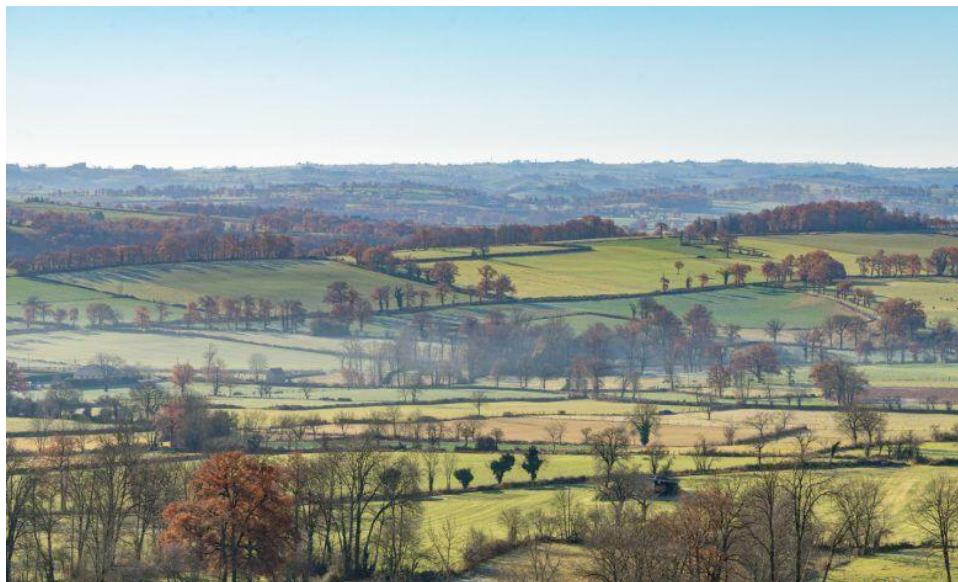
Paysage de l'Aveyron avec ses haies, plateau de Montbazens

Ne dissuadons pas ceux qui plantent et entretiennent les haies de le faire, mais valorisons-les et simplifions-leur les démarches !